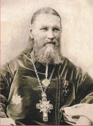
Праведный Иоанн Кронштадтский

На взаимном чувстве или понимании наших душ друг друга основывается действие или бездействие проповеднических слов: если проповедник говорит не от сердца, лицемерно, слушатели внутренним чутьем понимают несоответствие слов проповедника с его сердцем, с его жизнью – и слово не имеет той силы, которую оно могло бы принести в том случае, когда проповедник произнес бы его сердечно, особенно когда сам исполнял бы слово свое на деле.