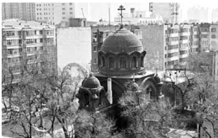
Храм Покрова Пресвятой Богородицы в Харбине

Перевод Великого покаянного канона вышел в свет незадолго до начала Великого поста. Перевел тексты и подготовил издание доктор филологических наук, профес-